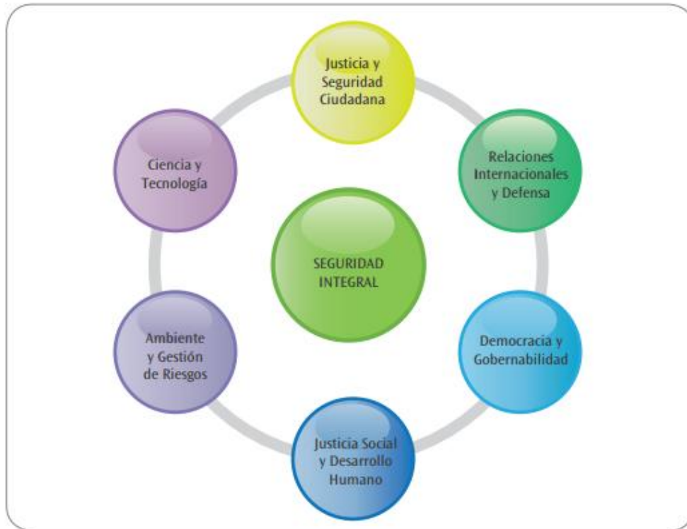
Figura 5 – Âmbitos da Segurança com enfoque integral

ministérios, incluindo o Ministério da Defesa, que passam a trabalhar de forma mais integrada: a segurança é encarada como uma política pública que engloba diversos âmbitos da sociedade.